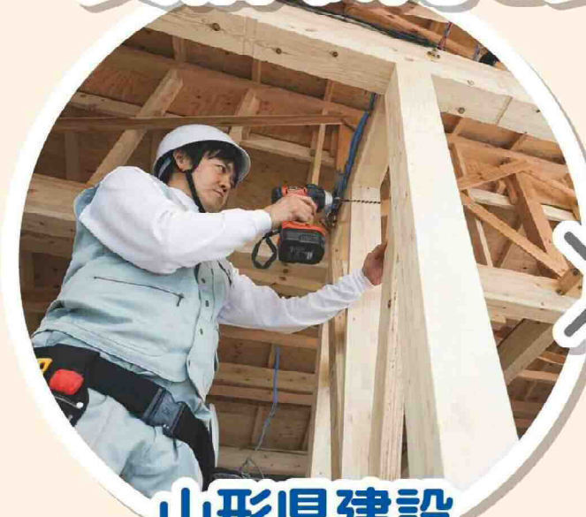
山形県建設 労働組合連合会